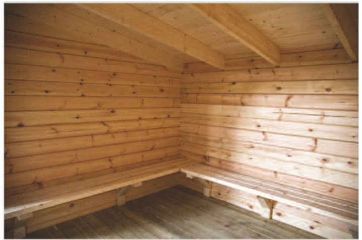
Laftet i vakker svensk furu