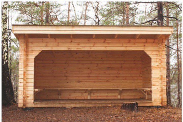
Enkelt og stilrent design